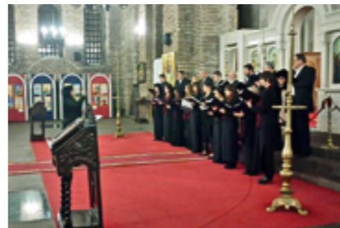
3. ХОР "КАСИАНА ДОМЕСТИКА", ШУМЕН, БЪЛГАРИЯ