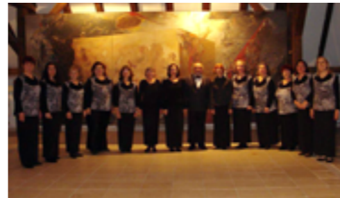
1. ДАМСКИ ХОР ПРИ ХРАМ "СВ. АТАНАСИЙ" ВАРНА, БЪЛГАРИЯ