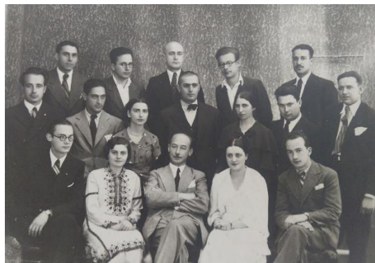
Като студент в Музикалната академия