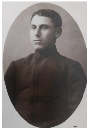
Ученик в Пловдивската духовна семинария

В храма при своя баща за първи път, бъдещият диригент и композитор, се докосва до църковната музика, която ще остави трайни следи в неговото професионално развитие. Като ученик в прогимназията прави впечатление с музикалните си заложби, но подтикнат от своя баща записва да учи Пловдивската духовна семинария.